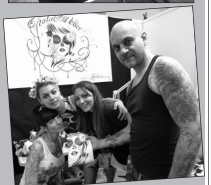
Des tatoueurs venus du monde entier travailleront sur place et devant leur public.