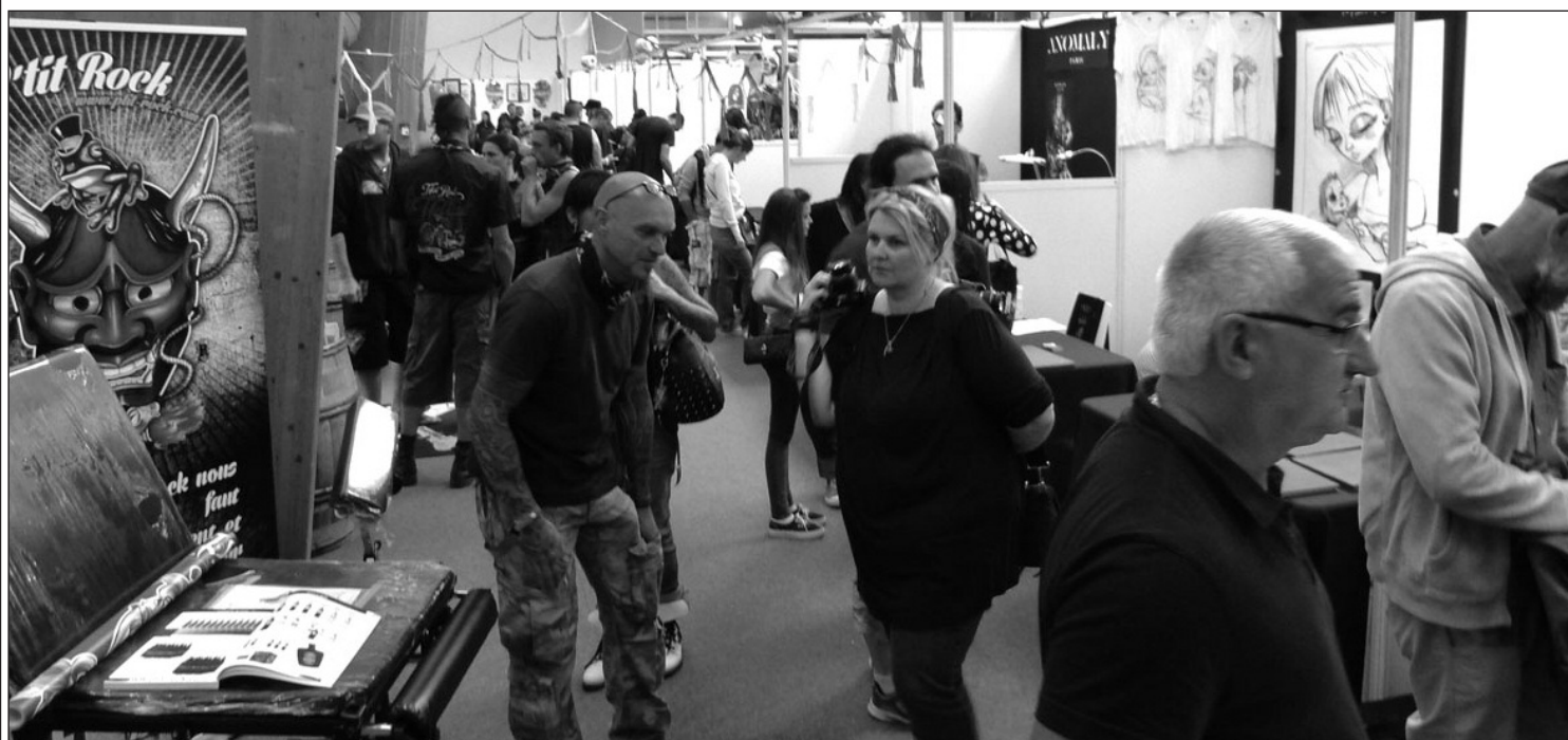
Dix mille visiteurs sont attendus à Chaudes-Aigues le premier week-end de juillet.